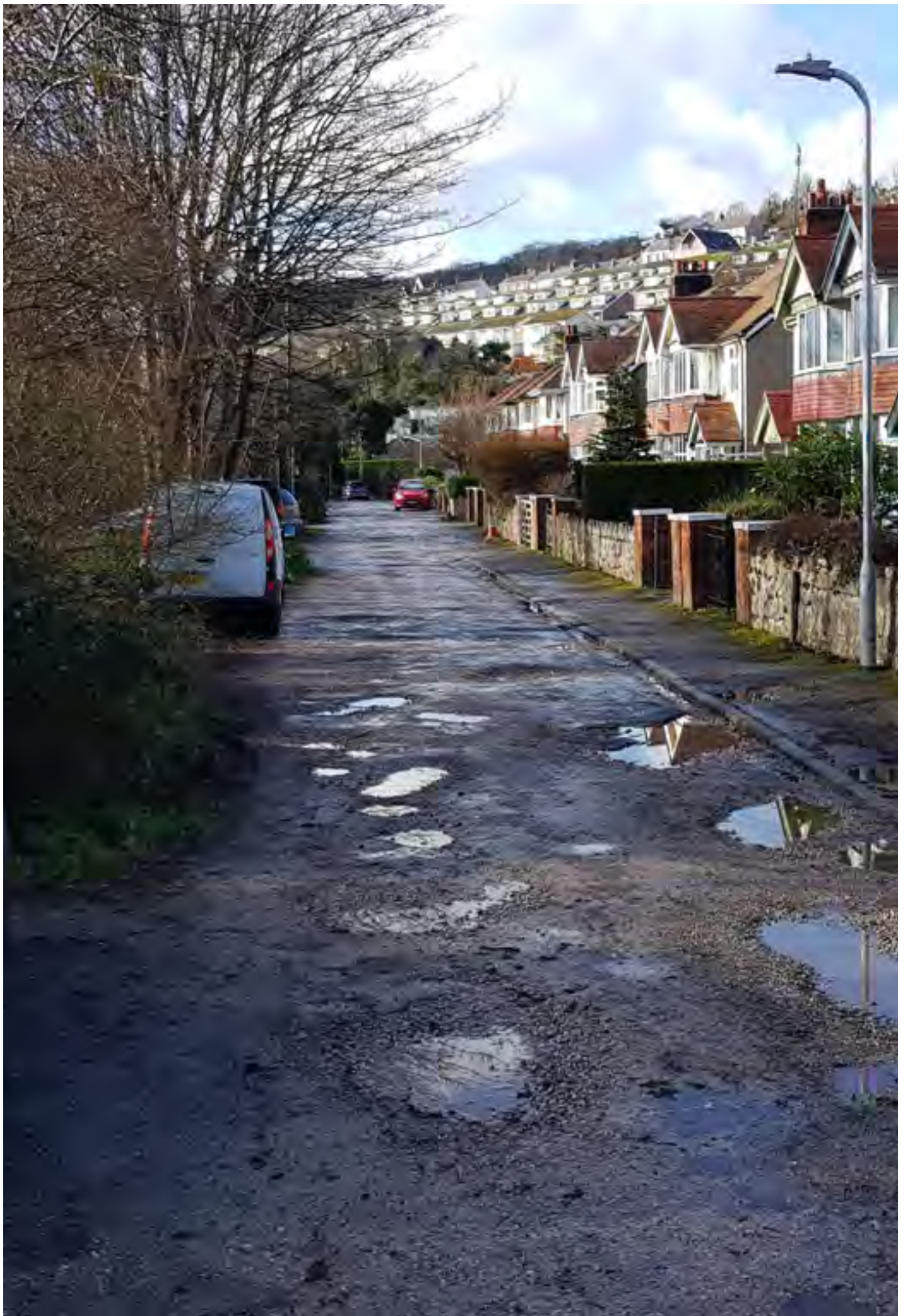
Tudalen 6 Ffyrdd sydd heb eu mabwysiadu yng Nghymru